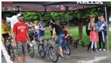
Deťom si mohli vyskúšať aj jazdu na bicykli.