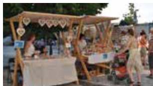
Nitriansky jarmok sa tohto roku presúva do mestského parku.

Celomestské oslavy Nitra, milá Nitra, ktoré sa uskutočnia v dňoch 2. až 5. júla, budú jedným z prvých podujatí, ktoré sa uskutočnia v rámci predsedníctva Slovenska v Rade Európskej únie. Získali tak nadregionálny charakter. Začnú sa totiž presne deň potom, ako sa Slovenská republika ujme svojho predsedníctva. K nadregionálnemu vnímaniu slávnosti prispieva aj pestrá paleta zábavných, duchovných i odborných podujatí, ktoré majú v mnohých prípadoch celoslovenský i medzinárodný význam.